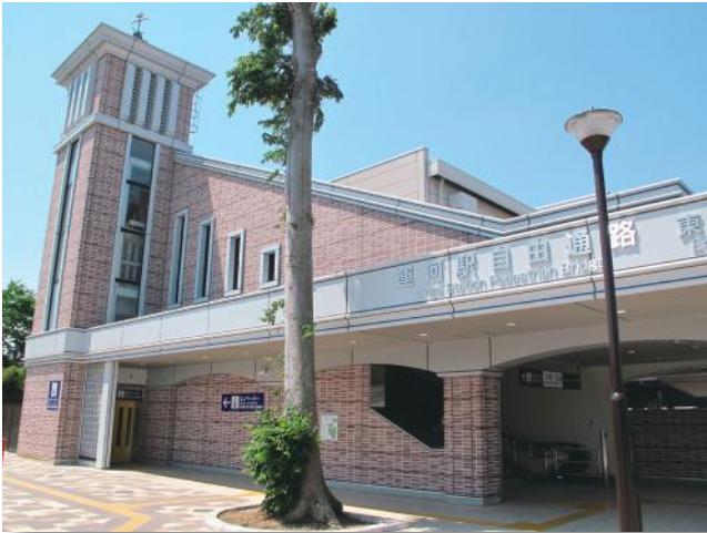
東武アーバンパークライン(野田線)運河駅