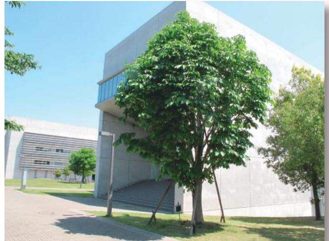
同窓会が植樹したセイヨウトチノキ