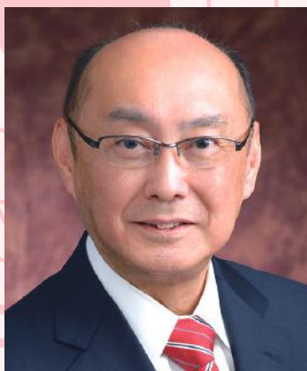
東京理科大学薬学部同窓会会長